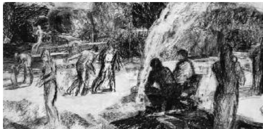
Janneke Tangelder , "Familiereunie Frankrijk" tekening/collage, ca 49 x 100, 2011