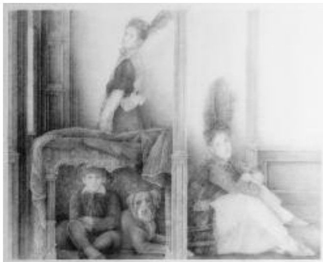
Jaap Schlee , Toneelrepetitie in de rue des martyrs in Parijs, potlood op papier, 114 x 144, 2006/2010