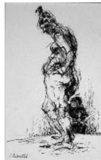
Ingeborg Oderwald , Hélène staat, pen en houtskool, 40 x 50, 2012