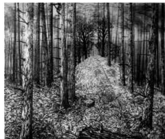
Edith Sont , V 1, 100 x 120, 2010