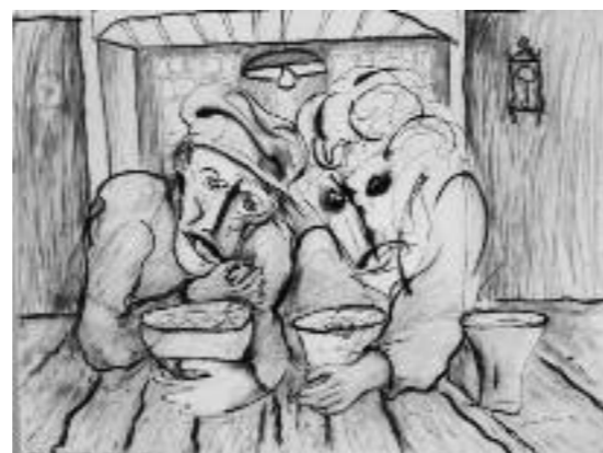
Wim Worm , Boer zoekt vrouw, 70 x 90, 2012