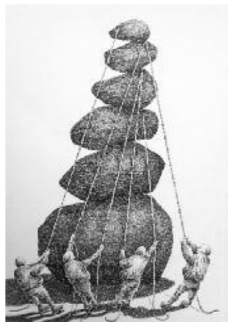
Jan Vosman , De omtrek, pentekening, 50 x 70, 2012