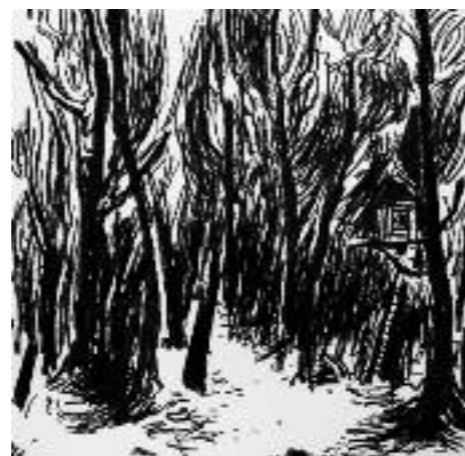
Wilma Laarakker , Into the woods/de boomhut, siberisch krijt op papier, 25 x 25, 2012