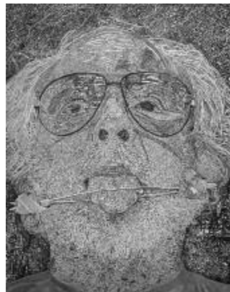
Fred van der Wal , Face Torture, 100 x 104, 2011

De tekening als kunstwerk heeft haar plek dus wel gevonden. Hoe zien jullie de toekomst van de discipline?